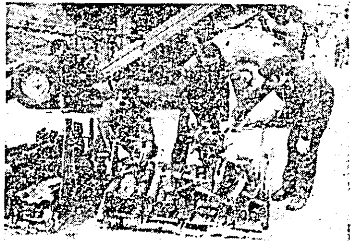
S.M.A. Chișineu Criș. Piese de motoare posibile a fi reconducute sînt adunate și sortate cu grijă.

să fie finalizate corespunzător și mai ales de calitate. Considerăm că eforturilor depuse de cei de la S.M.A. Chișineu Criș pe linia aprovizionării cu piese de schimb trebuie să le răspundă pe măsură, și baza de aprovizionare tehnico-materială pentru agricultură Arad. Cînd spunem aceasta avem în vedere nu numai asigurarea urgentă a necesarului de piese pentru actualele lucrări de reparații, cît și asigurarea minimumului de repere și subansamble pentru fiecare din atelierele mobile ce vor însoți formațiile de lucru. În acest context, o deosebită atenție se cere acordată, de pe acum, aprovizionării, bunăoară, cu necesarul de curele de transmisie, curele late, curele de la bătător și de la dispozitivul de descărcare al combinelor.