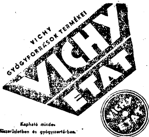
Kapható minden Szezerületben és gyógyszerárban.

Az eddigi eredmények Budán: Wolff-párt 6895, szociáldemokraták 2118, Rassay-párt 2494, nemzeti egységpárt 6080 — Délen: Wolff-párt 7362, szociáldemokraták 7478, Rassay-párt 4701, egységpárt 8603. — Északon: Wolff-párt 3452, szociáldemokraták 4477, Rassay-párt 6312, egységes párt 3690, Meskó pártja 393, Ruppert 2793, Friedrich 1119.