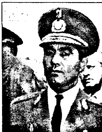
devină membră NATO într-o perioadă rezonabilă de timp.

- Din punct de vedere juridic există o diferență cât se poate de clară: Ungaria este membră NATO cu drepturi depline, iar România este doar aspirantă la acest statut. Totuși, cel puțin până în prezent, substanța colaborării dintre noi nu a suferit nici o modificare. Oricum, Ungaria a intrat destul de recent în Alianță și noi trebuie să profităm de această nouă calitate a vecinilor noștri. Cred că și Ungaria dorește ca România să