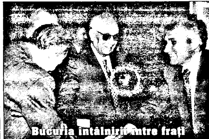
Bucuria întâlnirii între frați

Prezența distinșilor oaspeți la așezăminte culturale și instituțiile de învățământ universitar și preuniversitar (Palatul Cultural, Liceul „Moise Nicoară”, Facultatea de Științe Umanist-Creștine, Aula Facultății de Drept, Liceul