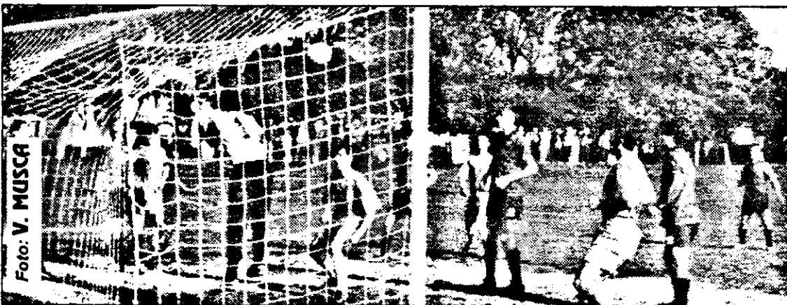
Dacă în meciul cu Șiria, „Podgoria” s-a impus (scor 4-3), în partida de miercuri, Minerul Moneasa a plecat cu toate punctele de la Ghioroc.