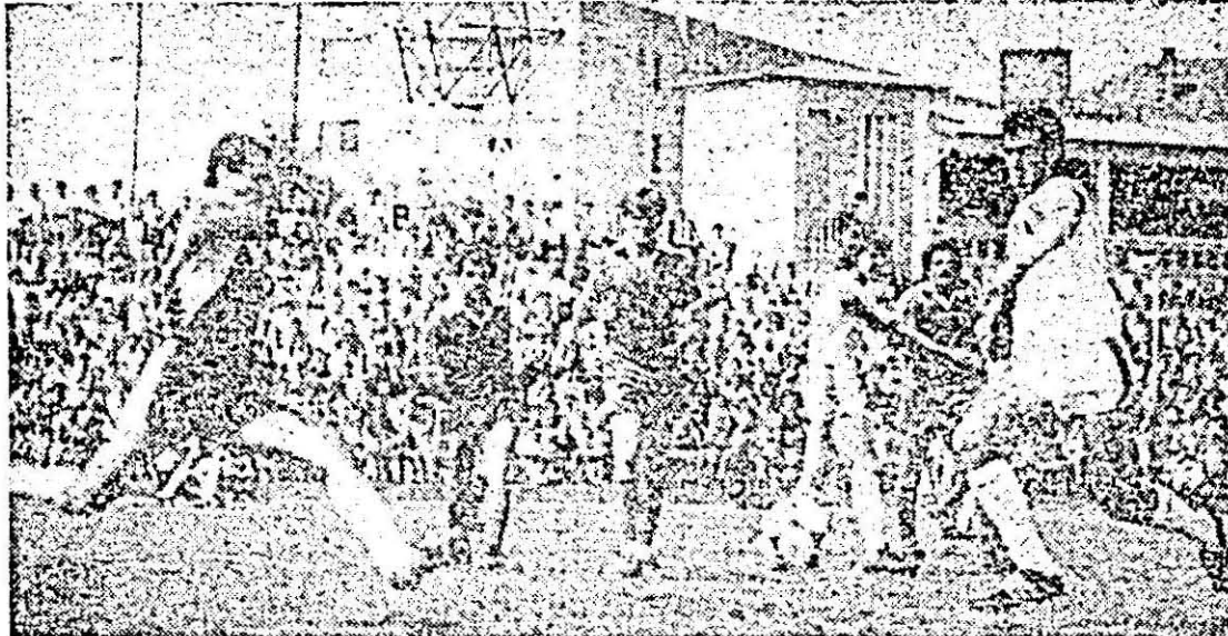
Fază din meciul UTA - CSM Reșița.

Oaspeții au avut o revenire, echilibrînd o vreme jocul pe la mijlocul reprizei secundă, au ratat o mare ocazie de gol în min. 75 prin Scinteie, apoi valoarea jocului (și așa nu cine știe cît de ridicată) a început să scadă treptat, ultima parte subliniind un fel de împăcare de ambele părți cu scorul înregistrat. Cu cîteva minute înainte de sfîrșitul final, Cura intrat de scurtă vreme, a mai vrut să schimbe ceva dar a ratat. Spectatorul au părăsit în velle bună stadionul, stare generată de excelențele momente cu altă forță emoțională prilejuite de înfrîngerea, primirea și ascultarea lui Duckadam, de jocul bun al arădenilor la început, de scorul favorabil și meritat.