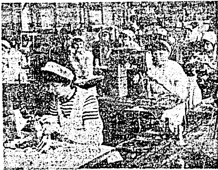
Aspect de muncă în atelierul pregătii-cusut al Întreprinderii „Libertatea”.