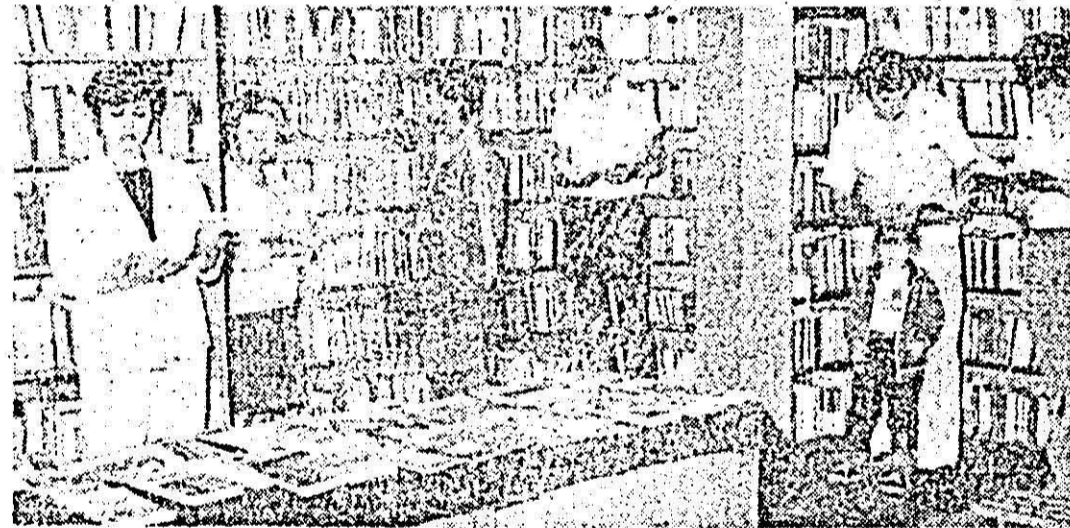
Biblioteca județeană Arad este vizitată zilnic, în medie, de 530 cititori. Instantaneu de la secția de împrumut la domiciliu.