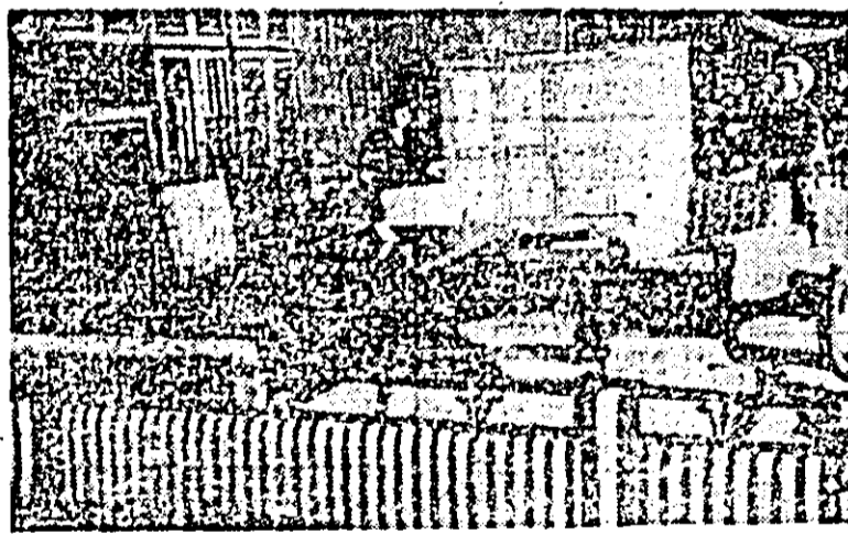
Un interior modern, cu o mobilă modernă, produsă de harnicul colectiv de muncă de la Combinatul de prelucrare a lemnului din Arad.

Ieri s-a deschis la Galerile „Alfa” expoziția de artă aplicativă și decorativă a artiștilor plastici din județul Arad.