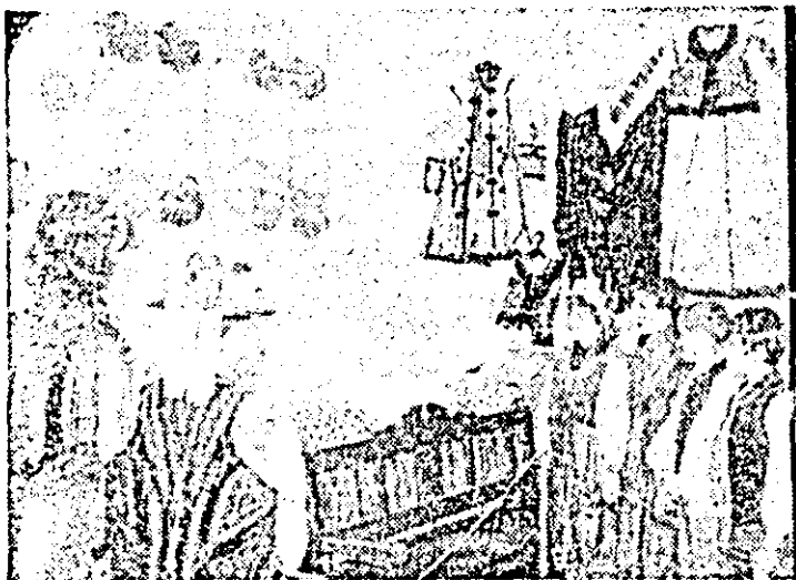
Aspect din muzeul școlar „Vatră strămoșească” recent amenajat în satul Gurba, comuna Șteia.