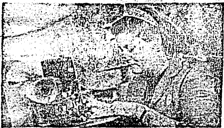
Secvență de muncă de la linia de pregătit-cusut nr. 4 a întreprinderii „Libertatea”. Dora Păcurar, lucrînd la mașina de în-doit de mare productivitate, un nou utilaj intrat în dotarea întreprinderii.