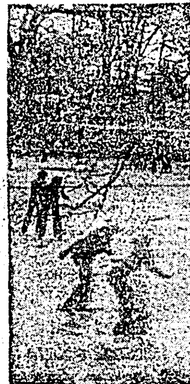
Pe luciul gheții lacului din Păduricea-Aradului...

După consumarea a două runde, în turneul internațional masculin de șah de la Belgrad conduc Tringov (Bulgaria) și Simic (Iugoslavia) — cîte 1 punct și o partidă întreruptă, urmași de maestrul internațional român Victor Cioclică, Pidevski (Bulgaria) și Sahovici (Iugoslavia) — cîte 1 punct etc.