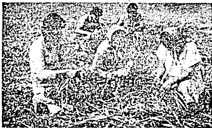
La asociația legumicolă Horia se lucrează intens la recoltatul usturoiului.

Cele semnalate în acest consiliu unic arată că e necesar să se ia măsuri hotărîte din partea tuturor factorilor de răspundere pentru folosirea tuturor forțelor mecanice și manuale la lucrările urgente din această perioadă, orice oră pierdută cîntărind mult în balanța producției.