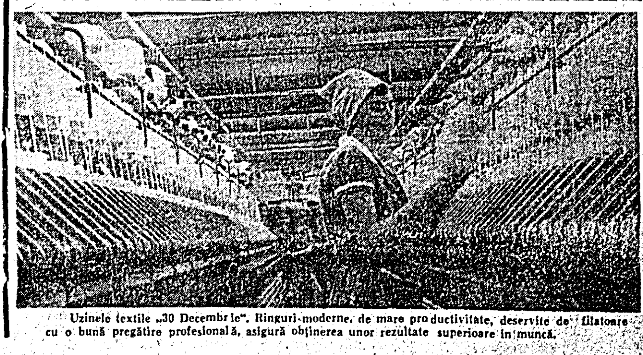
Uzinele textile „30 Decembrie”. Rînguri moderne, de mare productivitate, deservite de filatoare cu o bună pregătire profesională, asigură obținerea unor rezultate superioare în muncă.

O situație cu totul inadmisibilă am înțîlnit-o la secția de mecanizare nr. 7 a I.M.A. Șicula. Din 10 mecanizatori cîți ar trebui în mod normal să muncească la revizuire și reparare a combinelor și preselor de balotat lucrează numai cinci. Din cele 13 combine planificate de ELENA JUCU, FRANCISC SZILAGHY (Cont. în pag. a III-a)