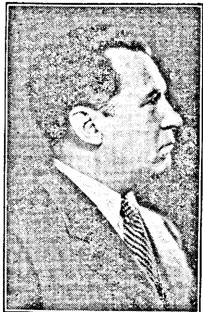
D. Victor Iamandi ministrul Justiției

discuție asupra obiectivelor, de interes pur general, vizate de aceste călătorii. Un proverb chinez spune: — „Când dirigitorii se înfor-