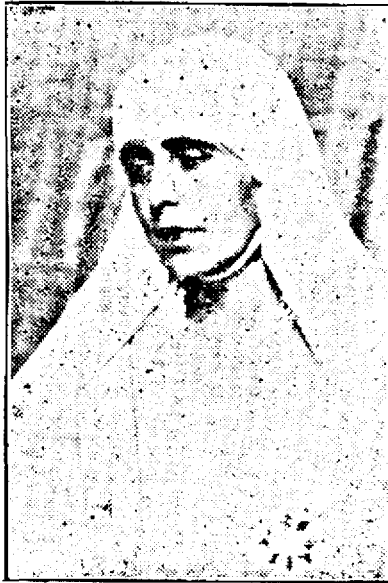
Majestatea Sa Regina Maria a României

La munte, deasemenea, în Branul ardelean, la castelul cățarat ca o căprioară pe vârful muntelui, grădina Reginei Maria este, în acelaș timp o splendidă rugăciune