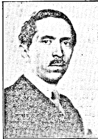
D. EUGEN TITEANU subsecretar de Stat la Minis- terul de Interne, însărcinat cu conducerea Direcțiunii Ge- nerale a Presei și Propaga- ndei Naționale

Mai presus de toate, însă, cea ca- re are de câștigat din această nu- mire este Presa: adică opinia pu- blică.