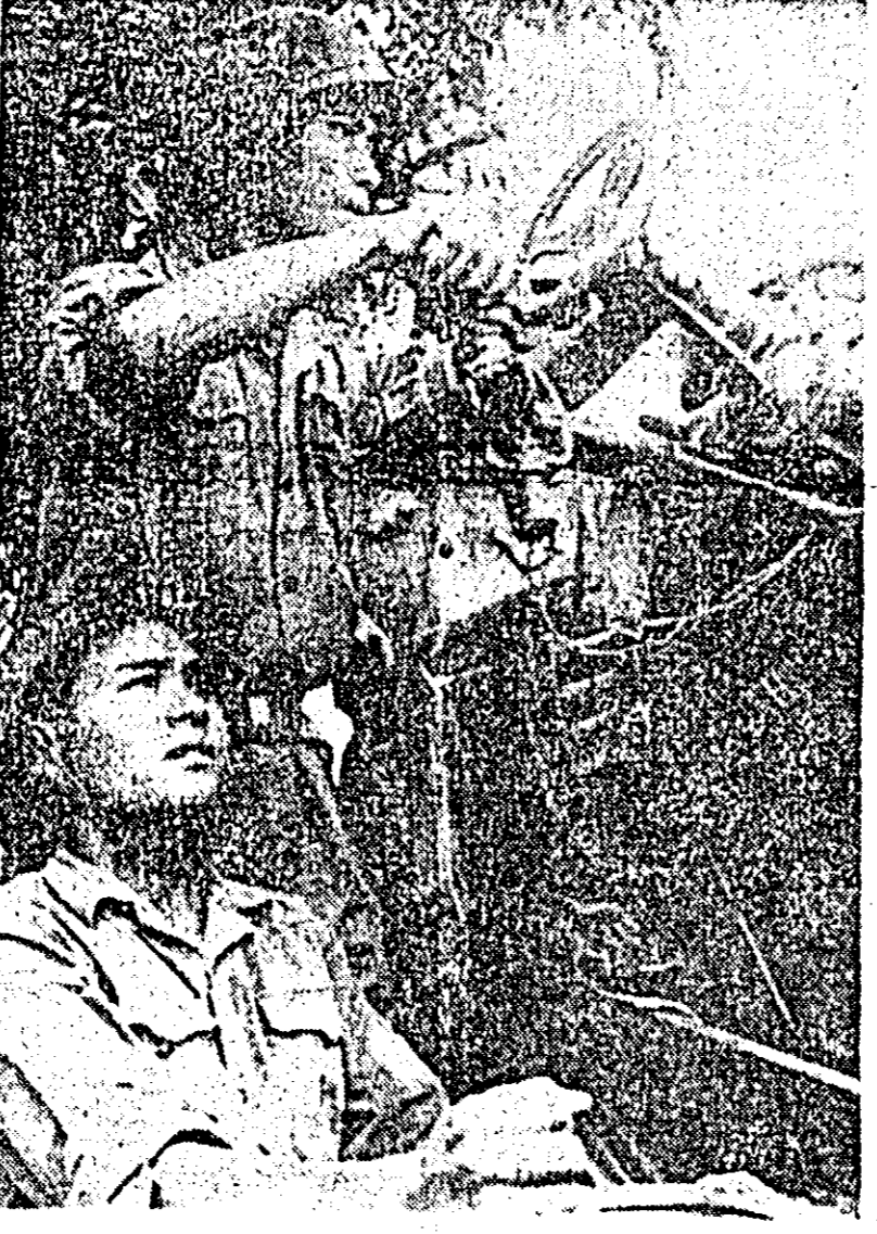
R.D. VIETNAM. IN FOTO: soldați în provincia Quang Binh, care au doborât un avion american deasupra provinciei lor.