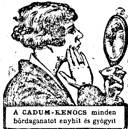
A CADUM-KENŐCS minden bőrdaganatot enyhít és gyógyít

(Antwerpen, március 13.) A Banque Credit Fonciere d'Anwers beszüntette fizetését és hitelezőknek 40 százalékos egyezséget ajánlott fel. A bírói vizsgálat azonban megállapította, hogy a bank mérlegeit 1920 óta rendszeresen hamisították. Eddig a bank vezetői és tisztviselői közül nyolcat tartóztattak le, míg Ségers igazgató öngyilkosságot követett el. A bankot 1913-ban alapították, 2 millió frank alaptőkével, amelyet időközben 10 millióra emeltek fel. A legutolsó kimutatás szerint tőkerekébetét formájában 47 millió frankot, folyamszámlabetét formájában pedig 49 millió frankot helyeztek el az intézetnél, legnagyobb részt földművelők és kisiparosok, miután az intézetnek 27 fiókja és 98 ügynöksége volt Antwerpen környékén és Flandriában.