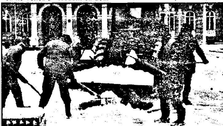
Ieri, Comandamentul pentru deszăpezire acționa doar în fața Primăriei. În rest, domnea un peisaj arctic. De va continua să ningă în același ritm, vom ajunge să circulăm prin tunele săpate prin nămeți!