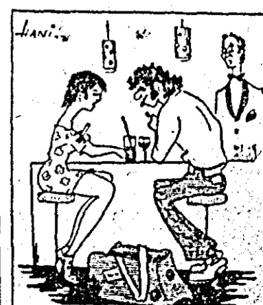
Continuăm aceeași tactică de „duplă”: Eu operez în Piața de vechituri, tu te așii la Astoria.