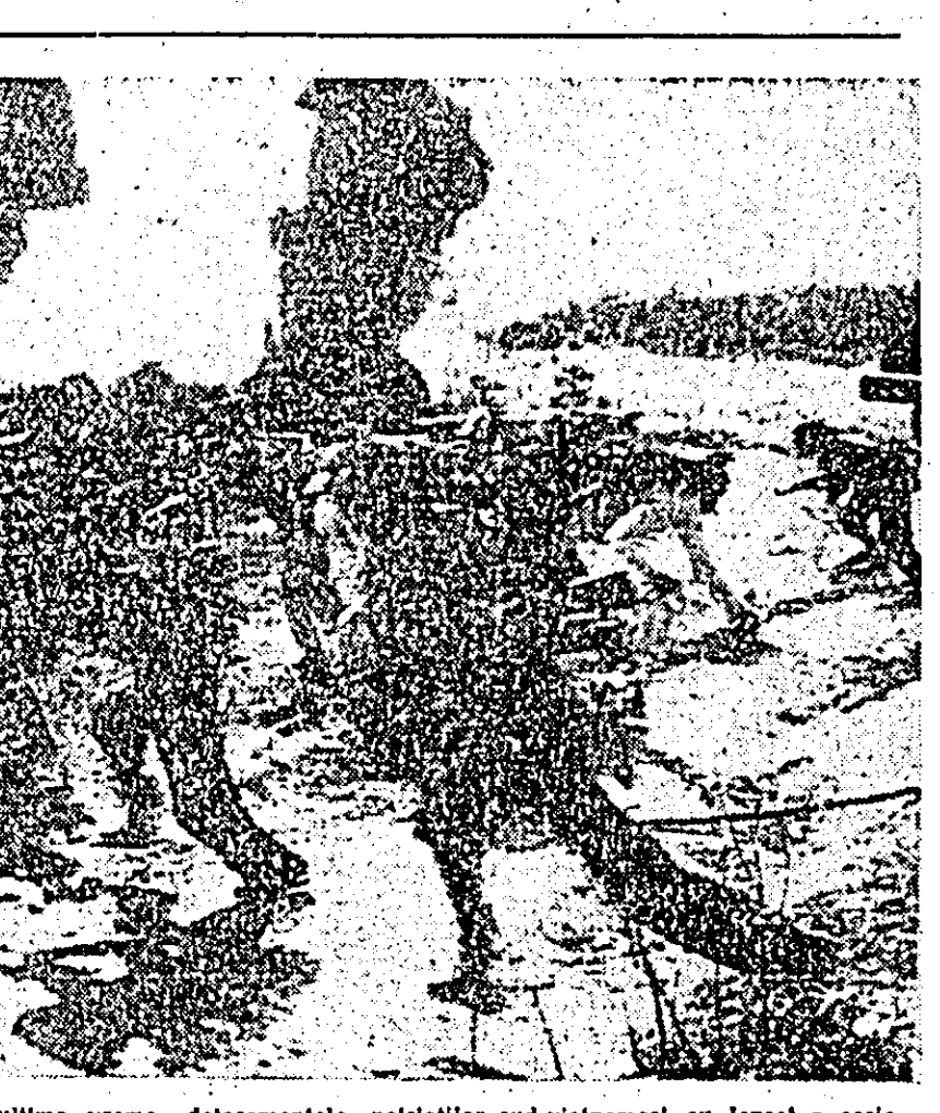
VIETNAMUL DE SUD. În ultima vreme, detașamentele patriotice sud-vietnameze au lansat o serie de acțiuni ofensive asupra rezervelor și pozițiilor americano-saigoneze, în special în zona septentrională a Vietnamului de Sud. În fotografie: Patrioti sud-vietnamezi, în atac.

XIENG QUANG 9 (Agerpres). — Forțele patriotice laotiene din provincia Xieng Quang au atacat în cursul zilelor de 27, 28 și 29 august mai multe tabere inamice înalte în zona septentrională a Văii Uciocelor. În urma acestor acțiuni ofensive, unitățile Pathet Lao au scos