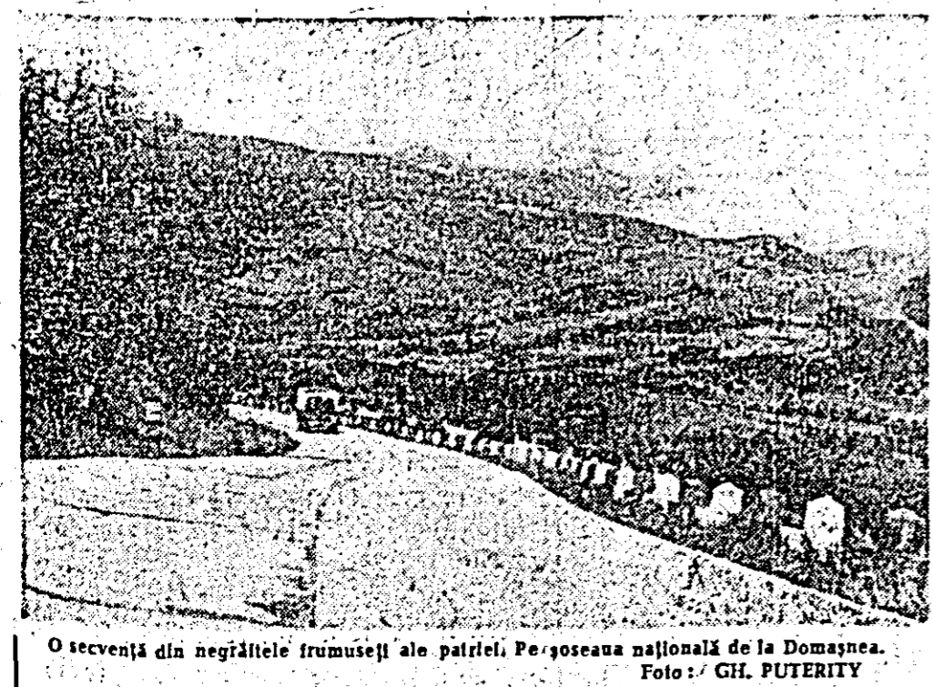
O secvență din negrițiile frumusești ale patriei. Pe șoseaua națională de la Domagnea.

Pe strada comercială - Istiklal Caddesi - mă pomenez într-o avalanșă de arome și mirosuri de chebab, de pește sau de grătar cu său.