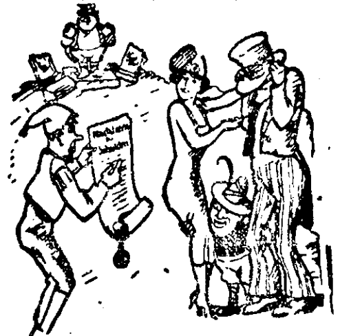
„Die Damen vor!“ der Michel spricht, Marianne (Frankreich) aber mag gar nicht. Verzeiht! Der Vortritt, bitte sehr, Gebührt dem Uncle (Amerika) überm Meer.“

(Deutschland verlangt Nachlaß der „Kriegsschulden“.)