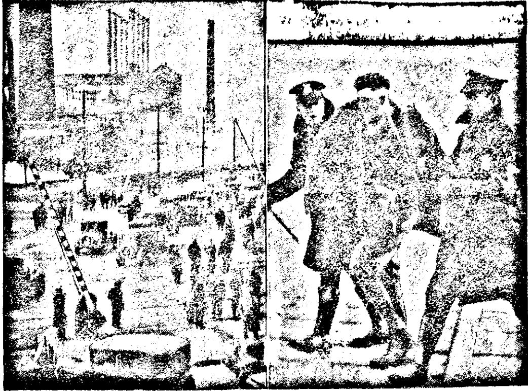
Ford-Fabrik in Dearborn (Vorort von Detroit.)

300 entlassene Arbeiter der Ford-Hauptfabrik in Dearborn unternahmen einen „Hungernach“ gegen die Werke. An den Toren der Fabrik kam es zu schweren Kämpfen mit der Polizei, bei denen 3 Personen getötet und viele verwundet wurden.