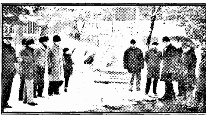
Comitetul format din cei pasionați de creșterea animalelor, peștilor, păsărilor etc., pe platoul din imediata apropiere a turnului de apă. În planul doi se văd pietrele ce trebuie mutate pentru a începe amenajarea pieței.