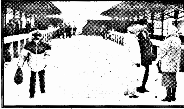
Fosta piață de hobby din zilele de duminică este acum părăsită, lăsând loc liber celor care stau „la una mică” ori, și mai rău, bișnițarilor de tot felul.

pregătite, singura problemă este ca Primăria să mute statuia. Nu ne rămâne decât să sperăm că