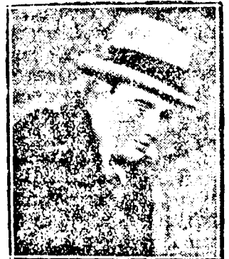
Al Capone. A gangster vezér még a fegyházban is maga vezeti azokat a gyárakat, amelyek a játékautomaták tizezreit dobálják Európának.

A XX. század csak ezzel az egyetlen találmánnyal ajándékozta meg a játék birodalmának évezredes, gazdag arzenálját.