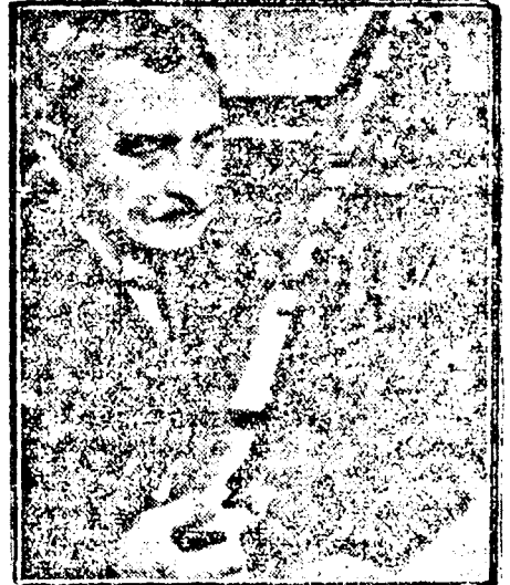
Kártyakeverő-gép. Tizenkét másodperc alatt tökéletesen megkever egy csomag kártyát.

A rómmi-köveket — a játék arzenáljának ezt az érdekes tagját — csak Romániában használják. A dominóból és a mah-yongból fejlődött ki ez a típus. Apró galalitból készült dominónagyságú kockákra — amelyek készülnek egészen díszes ki-