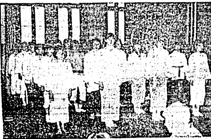
Aspect de la deschiderea competiției de judo de la Nădlac.