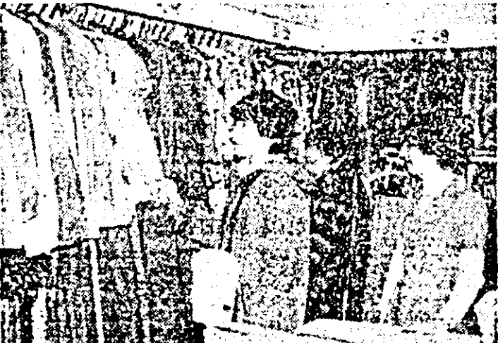
Magazinel de colecții „Eva” este bine aprovizionat cu îmbrăcăminte pentru sezonul de primăvară.

O viziune clară, am adăuga noi, asupra ceea ce înseamnă economie modernă, relații comerciale externe fructuoase. O cale sigură pentru o contribuție cît mai substanțială la echilibrarea balanței de plăți externe a țării.