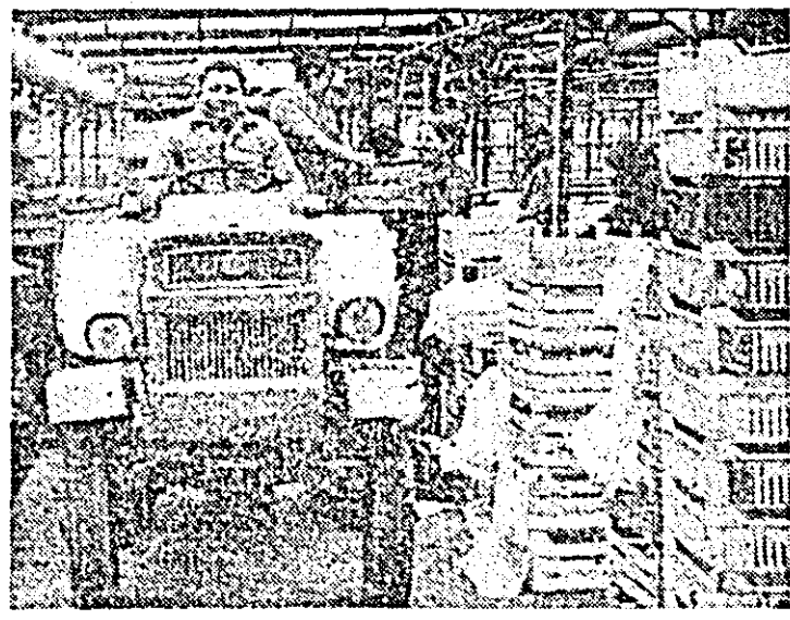
Recoltatul și transportul salatei la ferma nr. 4 a A.E.C.S. Sere Arad.

● Pe linia cunoașterii și respectării legalității socialiste s-a înscris masa rotundă organizată de comitetul U.T.C. „Tricolor roșu” cu tema „Forme și metode folosite de organizația U.T.C. pentru păstrarea și apărarea avutului obștesc”, la care au participat numeroși tineri din întreprindere. ● Sărbătorind „Ziua celerștilor”, tinerii din organizația U.T.C. de la nodul C.F.R. Arad au participat la evocarea „16 Februarie — moment istoric cu profunde semnificații în dezvoltarea conștiinței de clasă a muncitorilor din România”. ● La Clubul tineretului din Chișineu Criș a avut loc expunerea cu tema „Ținătura generației — prezență activă în cadrul mișcării pentru libertate, pace și progres social”. Evidențind contribuția României, a tovarășului Nicolae Ceaușescu în inițierea unor ample acțiuni privind dreptul la pace al popoarelor, sarcinile sportive ce revin tineretului ge-