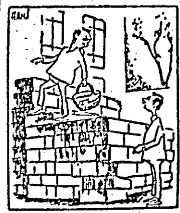
— Eu zic că e mai bine să facem un tunel.

Căile de acces spre pivnițele de lemne ale locatarilor imobilului în care este amplasat localul „Transilvania” — Piața Avram Iancu — sînt blocate de stivele de ambalaje ale amintitului local.