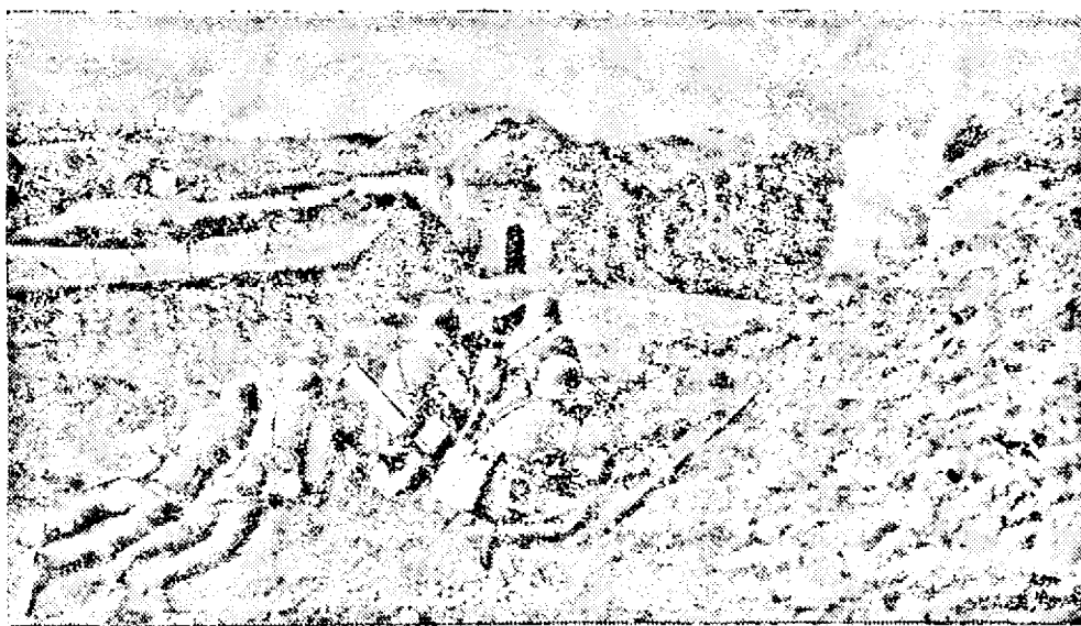
Cliseul nostru arată o scenă din film: asediarea fortului Douaumont la Verdun.

Toată lumea trebuie să vină să vadă această măreață inscenare. Veniți voi orfani, pentru ca să vedeți cum au pierit părinții voștri! Veniți voi mame, pentru ca să vedeți care le-a fost ultimul cuvânt al fiilor voștri, când și-au dat sfârșitul! Veniți cu toții, pentru ca să vedeți cum au fost schilodiți cei rămași infirmi, martiri ai celui mai mare măcel, căci lor a fost închinată această grandioasă operă.