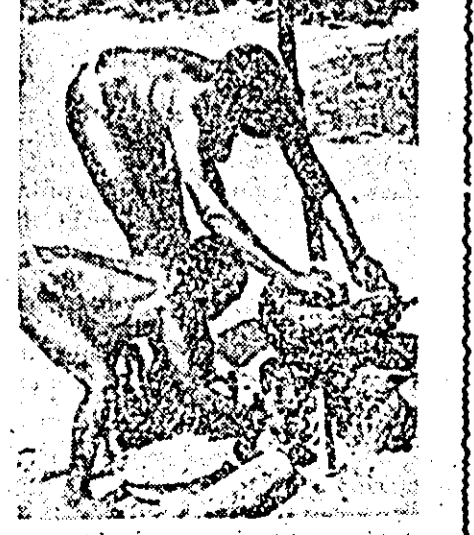
Milioane de congolezi trăiesc și astăzi în cea mai neagră miserie.