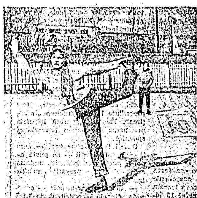
Patinajul este unul din sporturile preferate ale anotimpului rece al anului; el cerește tot mai mult aderenți. Vă prezentăm un aspect de la patinajul „Constructorul”.