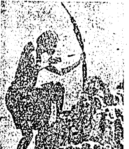
Arcul și săgeata mai sînt încă folosite pentru cîștigarea celor necesare traiului.

Împotriva demonstrațiilor din Leopoldville, armata a deschis focul. Partea locuită de populația de culoare a fost înconjurată cu sîrmă ghimpată. Tancuri și tunuri patrulează în întreg orașul. Puternice demonstrații au avut loc și în alte regiuni ale țării.