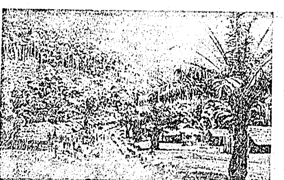
Imaginii din Congo belgian.

În ultima perioadă am asistat la desfășurarea unor evenimente care ilustrează procesul de destrămarea a sistemului colonialist în toată lumea și în special pe continentul african. Mișcarea de eliberare din Africa neagră nu mai poate fi oprită. Gravele incidente din Congo belgian, puternicele demonstrații din Leopoldville, capitala acestei posesiuni belgiene, care s-au soldat cu zeci de morți și sute de răniți confirmă acest lucru. La toate acestea se adaugă arestările în masă a populației locale care este supusă unor torturi barbare.