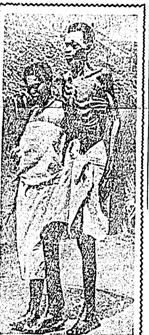
În timpul domniei colonialiștilor belgieni, foamea și bolile populației au secerat milioane de oameni.

La Institutul de genetică din U.R.S.S. au fost întăpuite cu succes lucrări de sporire a cantității de grăsime în lapte prin încrucișarea vacilor de rasă care dau lapte mult cu tauri din rasa Jersey, rasă care dă lapte gras și printr-o hrănire și îngrijire corespunzătoare. Într-o cireadă de vaci tinere, procentul de grăsime în lapte a fost sporit în medie pînă la 5,1 la sută față de 3,5 la sută cît reprezenta grăsimea în laptele dat de cireada de vaci mame.