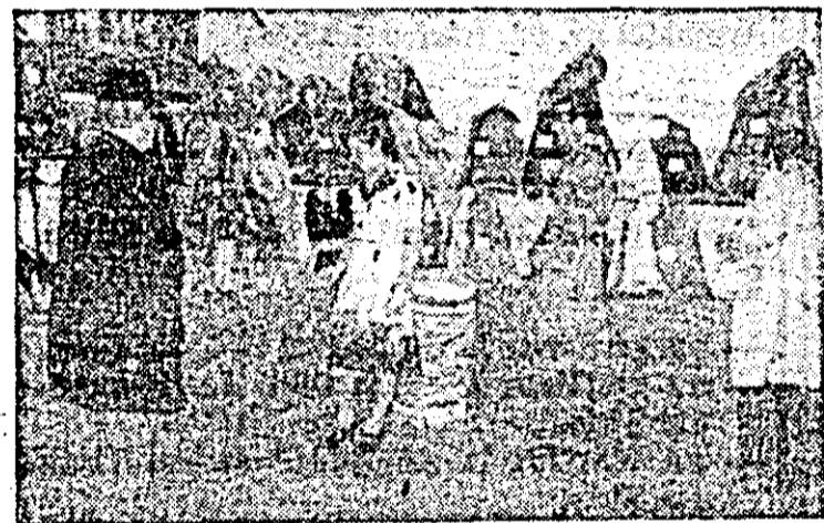
Meșteșugarii din diferite branșe de la C.P.A.D.M. Sebiș au prezentat recent, într-o mare expoziție organizată în localitate un mare număr de produse competitive pentru piața internă și chiar cea externă. Au putut fi văzute expozate bine apreciate: haine îmblănțite, cojoace, căciuli, dar și articole de sezon, cum ar fi tricotate, confecții textile, articole de marochinărie. PAVEL BINDEA, subredacția Sebiș