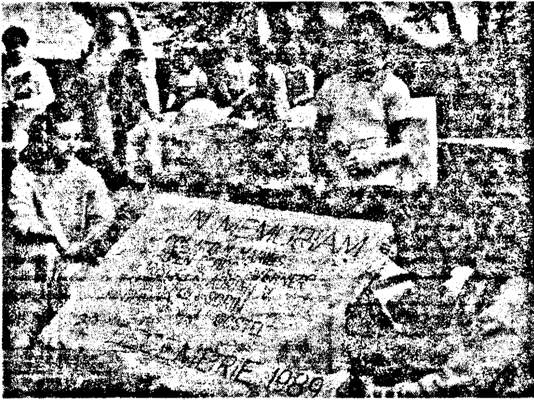
Flori și pîoasă aducere amînte la Monumentul Eroilor Militari, ridicat în Subcetă-te, în cinstea celor căzuți în Revoluția din Decembrie 1989.