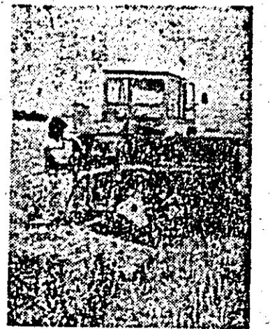
La I.A.S. Mureș, paiele sînt strînse și balotate imediat după seceriș.