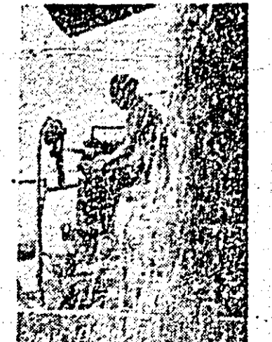
Recoltă bogată de grîu la lea ma Seblj a I.A.S. Ineu.