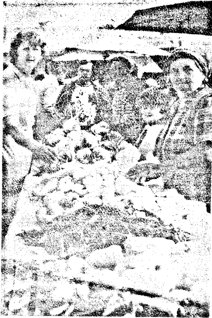
Piața „la zi”: produse, producători, cumpărători în Piața Filimon Sirbu (Catedralei)...