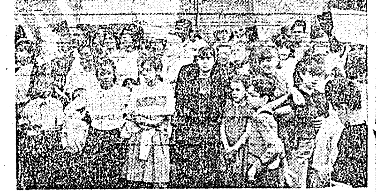
Pe străzile New Yorkului pichete de demonstrații, protestează zilnic împotriva politicii americane în Vietnam, cerînd încetarea agresiunii și întoarcerea soțiilor, fiilor și fraților lor acasă.

SAIGON 30 (Agerpres). — În urma ultimelor evenimente, în Vietnamul de sud se semnalează o tensiune maximă, poate cea mai mare înregistrată în timpul actualei crize. Populația este în fierbere, iar guvernul, depășit de evoluția situației, încearcă zadarnic să găsească o leșire oarecare din criza politică. La Saigon, Dalat, Hue, precum și în alte orașe din centrul Vietnamului de sud au avut loc duminică masive demonstrații antiguvernamentale și antiamericane. Peste 20.000 de oameni, relatează corespondenții de presă, au marșat pe străzile capitalei sud-vietnameze în „memoria celor căzuți la Da Nang luptînd împotriva armatei generalului Ky”. Refuzul primului ministru de a-și prezenta demisia, menționată AFP, precum și sprijinul pe care autoritățile americane continuă să-l acorde, împotriva protestelor hotărîte ale sud-vietnamezilor, au provocat o amploare nemaiîntîlnită a gesturilor singulare, a protestelor dramatice ale unei populații exasperate. De curînd, la Saigon un tînbudist și-a făcut harakiri, după un vechi obicei al samuraiilor japonezi. La Saigon și Hue, cîteva sute de persoane se află în greva foamei. Duminică, două tînce budiste și-au dat foc, iar luni dimi-