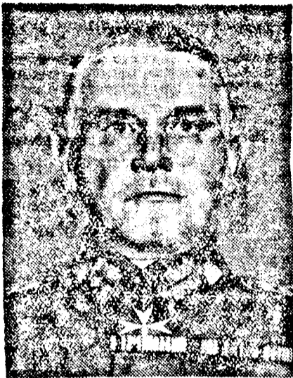
BLOMBERG nemzetvédelmi miniszter

Az osztrák sajtó ugyanolyan hangnemen ír a vasárnapi választási eredményekről, mint az angol. Egyes bécsi lapok nyolcmillió ellenzéki szavazatról tudnak és ezt úgy kom-