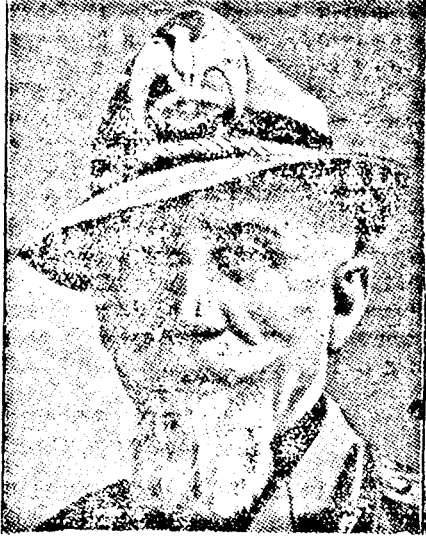
DE BONO tábornagy

Rómából jelentik: De Bono tábornagy ma párbajra hívta ki Lesona olasz gyarmatügyi minisztert. Legutóbb ugyanis De Bono könyvet írt az abesszin hadjáratról és ebben a könyvében a háboru előkészítésével és vételeivel kapcsolatban