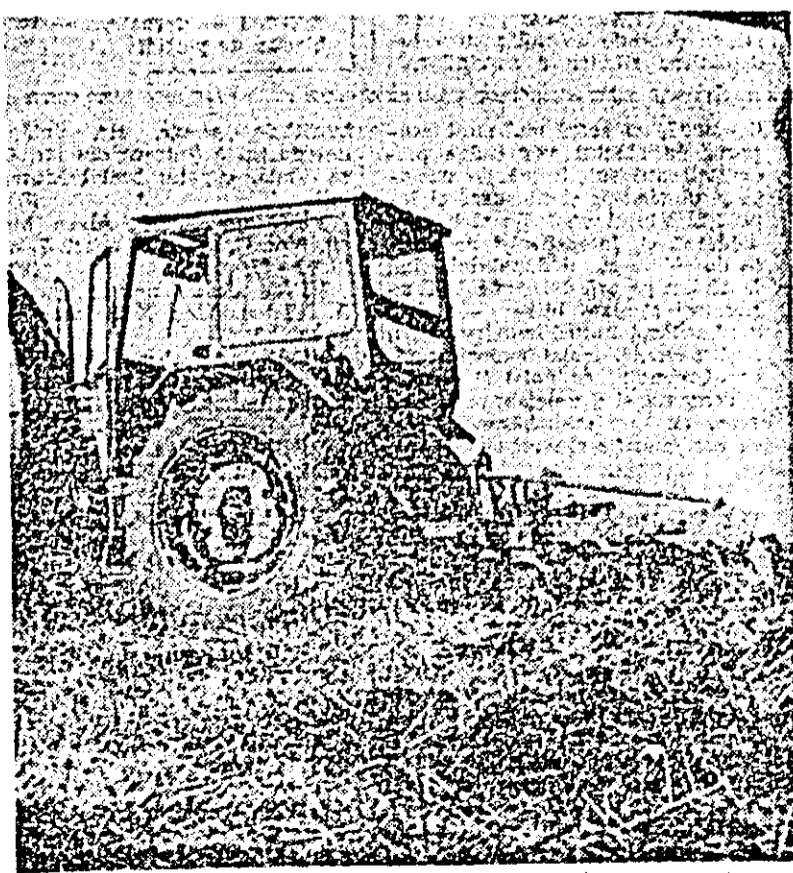
Pe ogoarele C.A.P. „Șiriana” din Șiria se lucrează intens la efectuarea arăturilor de toamnă.

muncii, folosirea nerațională a mijloacelor de transport. Într-un recent raid efectuat prin unități aparținătoare de consiliul unic agroindustrial Vinga, bunăoară, deși am găsit în câmp multe grămez de porumb, am întâlnit prea puține echipe de încărcat-descărcat, și mai puțin oamenii la depănșat. Iată de ce, pentru creșterea ritmului de transport este necesară mobilizarea oamenilor la încărcat porumbul din câmp în mijloacele de transport și la depănșatul celui recoltat mecanic. Pînă va fi pus la adăpost ultimul ștulete, toată suflarea satelor trebuie să participe la aceste lucrări!