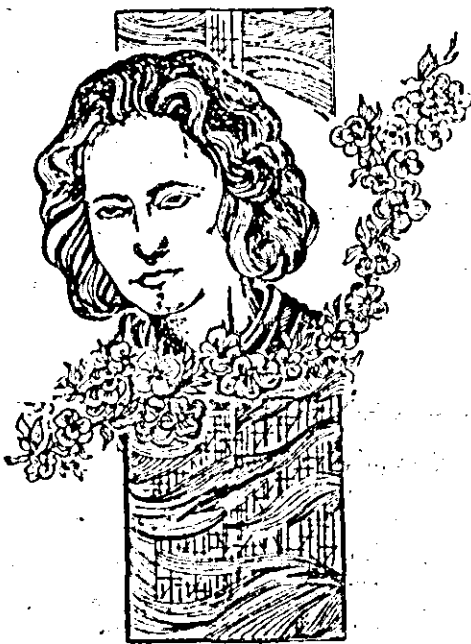
Omagiul

Pentru sprijinul permanent pe care ni l-a acordat nouă, oamenilor muncii de la Combinatul de Ingrășăminte chimice din Arad, pentru înaltul spirit revoluționar și devotamentul nețărmurit cu care-și consacră întreaga energie, marile capacități de om politic, de conducător și om de știință cauzei nobile a progresului României socialiste, pentru generosul și profundul său umanism, îi aducem acum tovarăsei Elena Ceaușescu, cu prilejul aniversării zilei