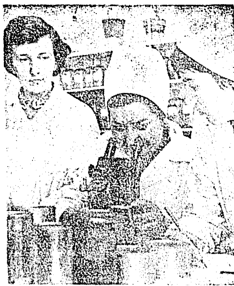
Laboratorul fabricii Refacerea a Combinatului de industrie alimentară. Produsele fabricii sînt supuse permanent observației și cercetării pentru a satisface toate condițiile calitative cerute de consumatori.