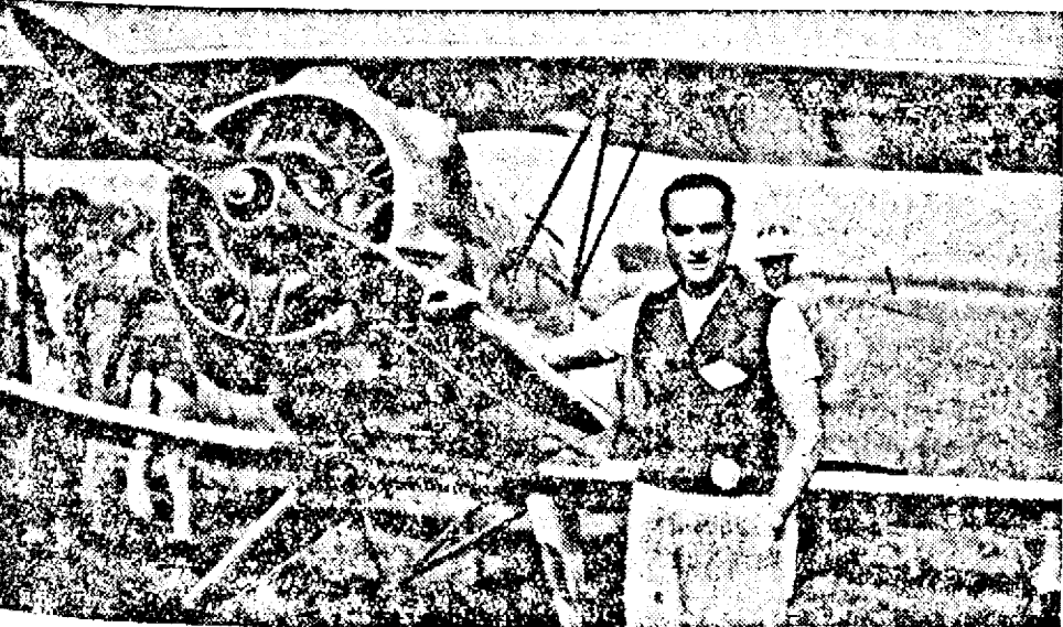
Championul român Căp. Papană în fața avionului cu care a câștigat campionatul mondial de acrobație în Havana (Cuba).

Regimentul 38 Artilerie aduce la cunoștință publică, că în ziua de 1 Martie 1940, ora 9 a. m., se va ține licitație pentru arendarea grădinei de zarzavat din Ciarda Roșie. Informațiuni la Biroul cazarmărei, Reg. 38 Artilerie Timișoara I, cazarma Transilvania.