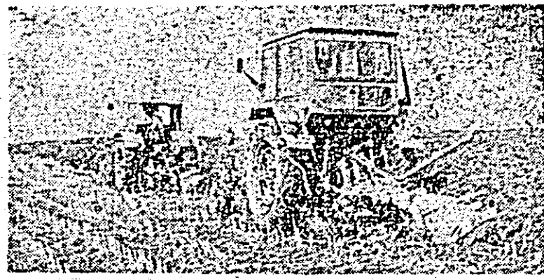
Ferma I a I.A.S. Aradul Nou. Imediat după recoltarea porumbului, pe terenul eliberat, tractoarele răsfoiesc brazde adînci pregătind pămîntul pentru semănăturile de toamnă.

La I.A.S. Barațca, în aceste zile domnește un freacă neobișnuit. Este zorul culesului de struguri. La ferma a IX-a, condusă de comunistul Ioan Kasl, oamenii nu mai prîdidesc cu recoltatul, căci