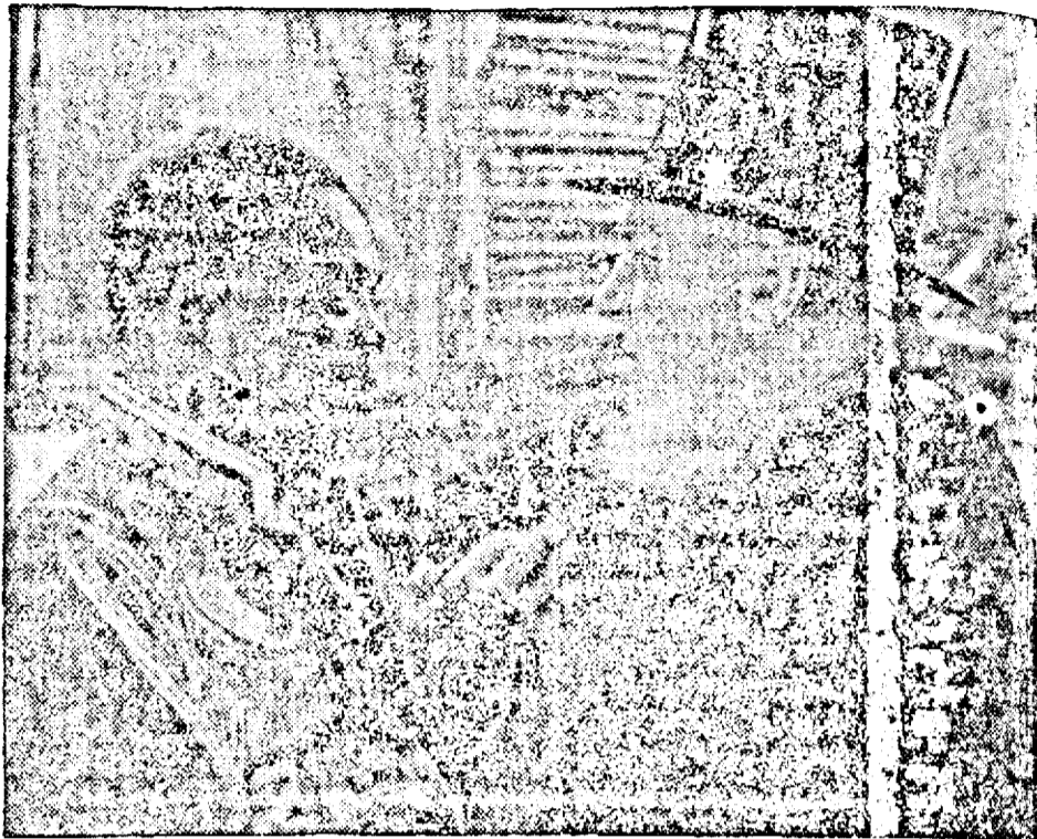
O scenă din monumentalul film: Ohm Krüger cu Emil Jannings

schijat în linii sugestive, momentele principale ale vieții sbuciumatei eroine Annelie și, la rugămintea corespondentului nostru, ne-a acordat dreptul exclusiv cunoscut cititorilor noștri.