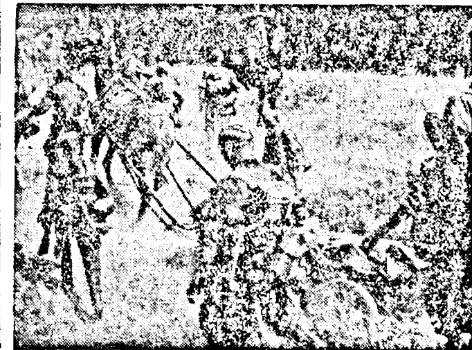
Pe frontul de răsărit, artileria antitanc germană, înaintează necontenit.