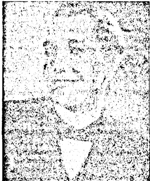
O nouă speranță a filmului german

Puține actrițe de cinema acceptă să interpreteze pe eran personajii de femei mai bătrâne decât sunt ele în viața de toate zilele. Fiecare vedetă caută,