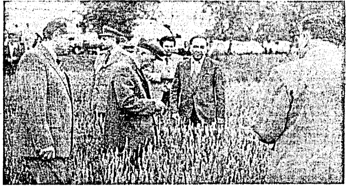
Indrumări prețioase la fața locului.

De numele ilustrului nostru conducător sînt legate cele mai mari izbânlzi din anii istoriei noastre noi care au conturat în timp „Epoca Ceaușescu”. De numele tovarășului Nicolae Ceaușescu se leagă marea prestigiu de ca-