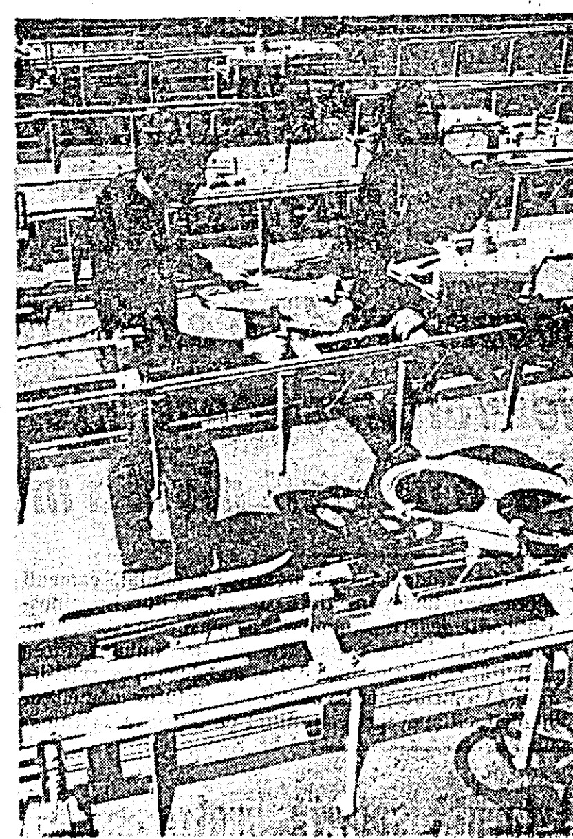
Atelierul C.T. C.F.R. — În lucru un nou lot de semnale destinate magistrelor de oțel ale patriei.

„Statul major al găzilor patriotice din județul Arad, în numele ofițerilor, subofițerilor, al tuturor comandanților din găzile patriotice — se spune în telegrama trimisă Comitetului Central al Partidului Comunist Român, tovarășului Nicolae Ceaușescu — se angajează în fața conducerii de partid, ca paralel cu pregătirea militară să desfășoare o neobosită muncă politico-educativă pentru traducerea în viață a măsurilor indicate, pentru promovarea spiritului muncitoresc, partinic, în rândurile luptătorilor, pentru educarea lor în spiritul patriotismului socialist și promovarea înalțelor trăsături morale-politice ale comunistului”.