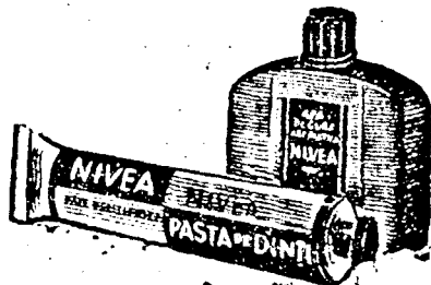
Kapható habzó- és nem-habzó fogpaszta

a cigarettafüst pedig nyomait hagyja a fogakon. Mi sem könnyebb, mint azokat eltávolítani. NIVEA-fogpaszta kíméletesen csillogó fehérre tisztítja a fogakat: NIVEA-szájviz üdít és kellemes leheletet ad.