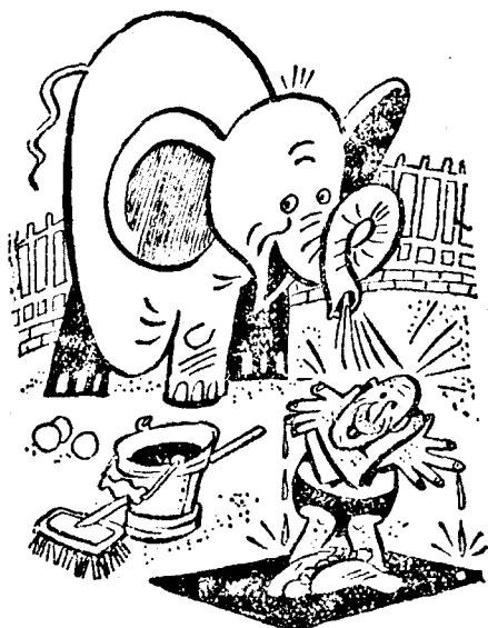
avagy: alkalmi zuhany a kánikulában!

— Javul a magyar miniszterelnök állapota. Budapestről jelentik: Gömbös Gyula magyar kormányelnök állapotában javulás állott be. A hónap közepén Gömbös Nagytétényből a Bakonyban levő Királyszállásra utazik és ott tölti el idejét augusztus 9-ig, amíg szabadsága lejár. A szokásos évi nagy nyári minisztertanácsot is itt fogják megtartani Királyszálláson Gömbös elnökletével.