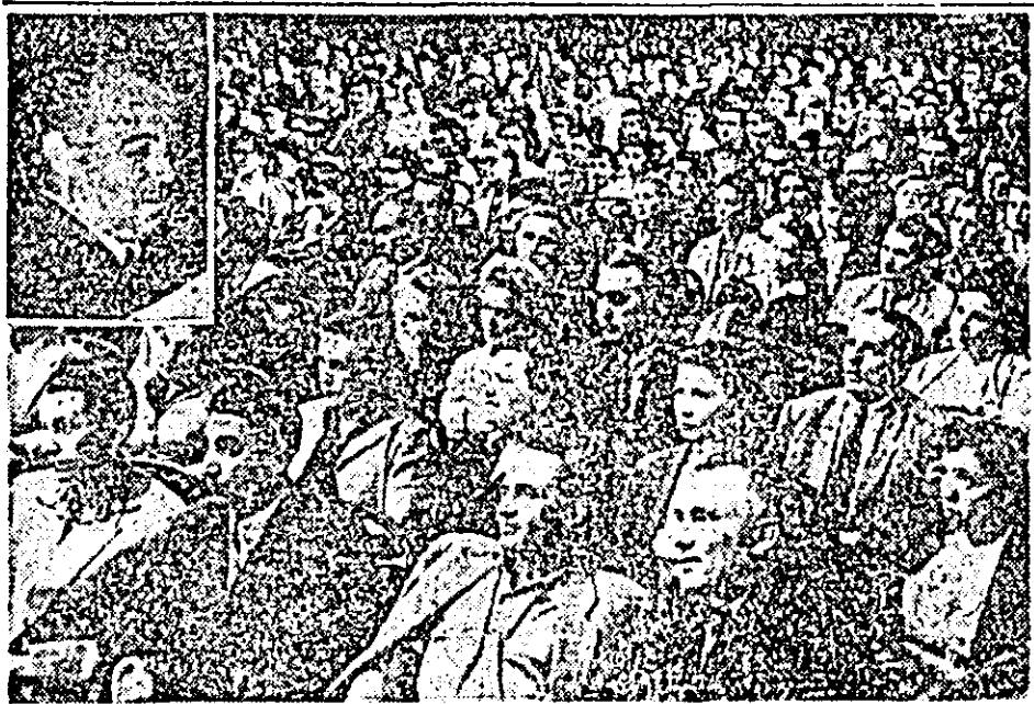
Aspect din sala Palatului cultural cu prilejul sărbătoririi Zilei învățătorului.