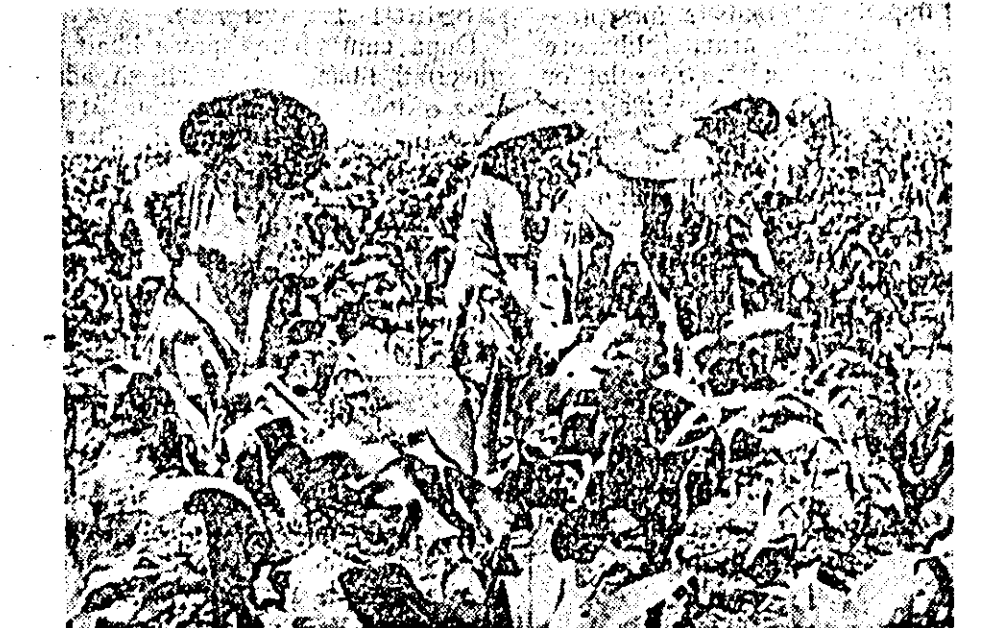
Se efectuează a doua prașă manuală. Cit e de ușoară această muncă, dacă mai înainte au fost făcute patru prașile mecanice.

tru prașile mecanice și două manuale. Și vom mai prași porumbul dacă va fi nevoie. Recoltă trebuie să iasă. Dacă vreți să vă mai notați un amănunt despre sîmînță: această lucrare s-a făcut în mod diferențiat, în funcție de starea solului — la 90X40 cm, 80X40 cm și 70X50 cm. În general avem cite 28.000 de plante la hectar.