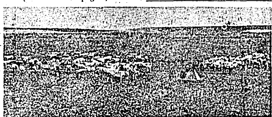
În valea Izvorin pășunează în ti hna cele 214 bovine ale gospodăriei colective.