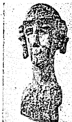
Dumitru Șerban: „Fată din Arăneag’