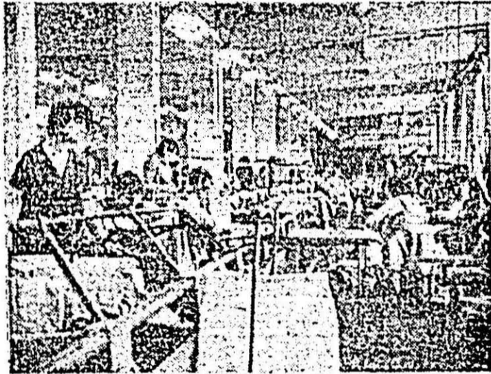
Aspect din secția a III-a a întreprinderii de confecții Arad.

● În cadrul acțiunilor de muncă patriotică, numeroși uteciști din școli și întreprinderi economice au participat la deszăpezirea căilor de acces în municipiul Arad. De asemenea, au fost recuperate sticle, borcane și hîrtie în valoare de 80.000 lei de către uteciștii de la căminele de nefamilii ale întreprinderilor „UTA”, „Libertatea”, I.V.A. și I.M.U.A.