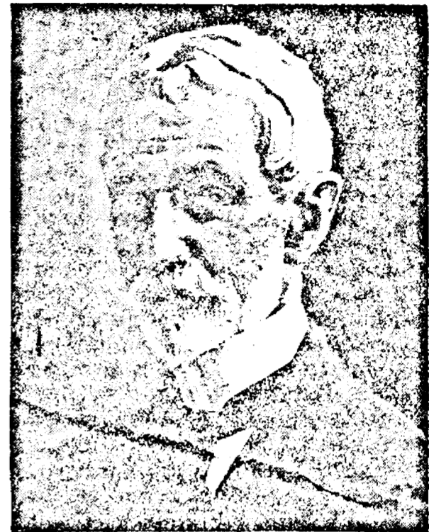
D. Prim-ministru General AL. AVERESCU

Dupăcum am știut, fiind în opoziție, să nu confundăm opoziția cu turbulența, tot asemenea, deținând azi puterea, vom ști să facem a se respecta ordinea, după pilda pe care am dat-o.