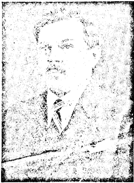
DI VASILIE BONEU prefectul județului Arad

întotdeauna pacinic și mulțumit când cei de sus în afară de aplicarea strictă a articolelor de lege nu-i desconsiderează anumite interese de ordin comun. Cât privește tratamentul minorităților el nu va suferi nici un fel de schimbare în rău și-mi voi da toate silințele ca eventualele fecărări sau nemulțumiri să fie înlăturate și satisfăcute cu demnitatea unui stat civilizat care născut.