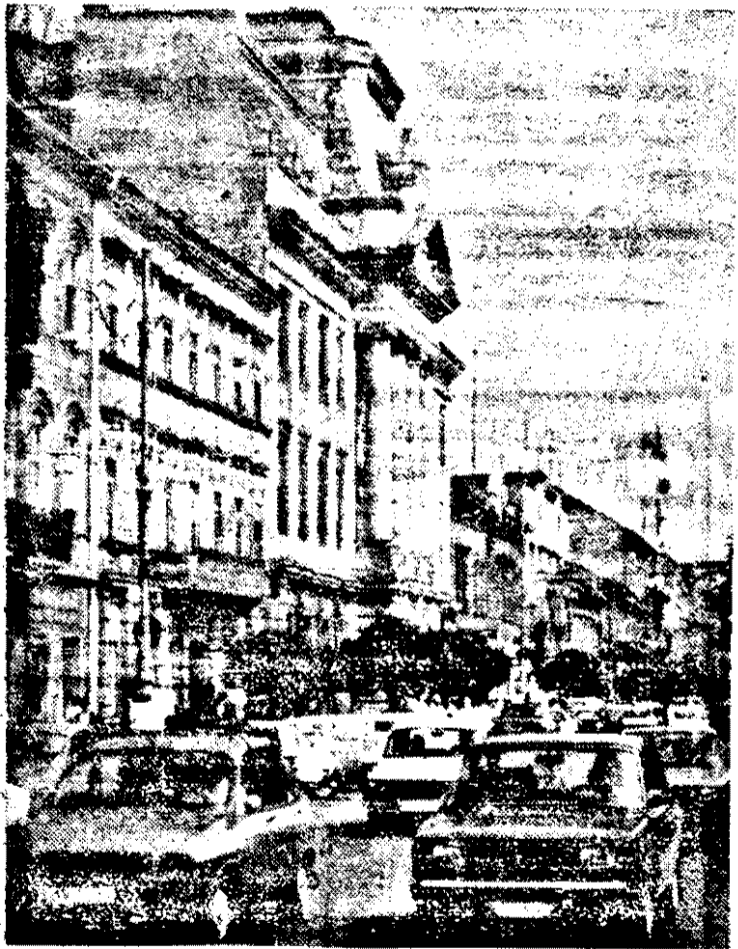
Dintr-un punct de vedere sîntem în Europa: din cel al aglomerației de mașini pe carosabilul Aradului.