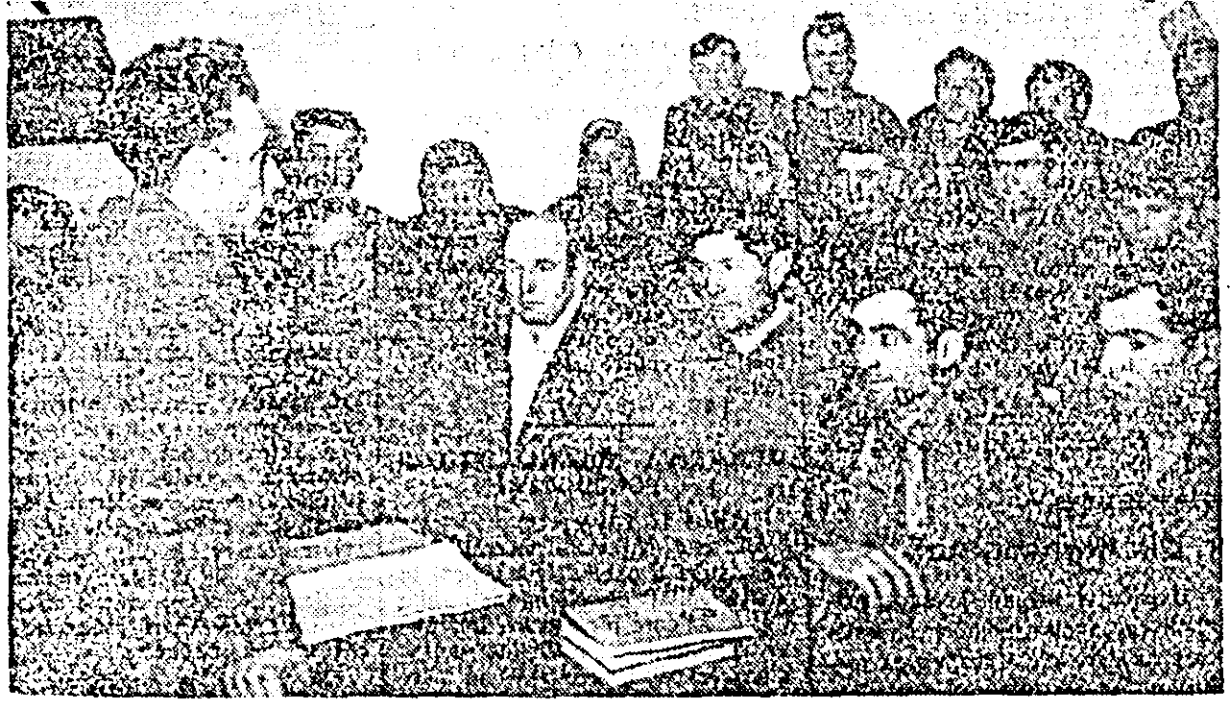
IN CLIȘEU: aspect de la cercul zootehnic.

Îmi aruncă ochii pe caietul vecinului meu, un om ceva mai în vîrstă. Descifrez cu ușurință câteva cuvinte subliniate: vitamine... rahitism... avitaminoză... sterilitate. În dreptul fiecăruia (lămurirea necesară redată așa cum a înțeles-o, cum i s-a întîmpărit în minte. Un om venit să-și adape mîntea la izvorul nesecat al științei și-a notat cu grijă aceste expresii pentru a le duce acasă, cu gîndul probabil să le arate și alieului. Și ea el au procedat toți cei aproape 60 de cursanți prezenți azi în această sală. Este un lucru mărunț, dar care cuprinde în el o semnificație mare: dorința acestor oameni de a-și îmbogăți necontenit nivelul de cunoștințe profesionale, grija pe care partidul nostru o manifestă pentru a pune la dispoziția acestora sub orice formă comorile necesare ale științei.