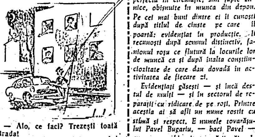
— Alo, ce faci? Trezești toată strada! — Cine vă pune? Eu am interes să trezesc doar pe cel ce m-a chemat!

Unii șoferi de pe taximele au obiceiul să claxoneze noaptea în zău în fața casei unde au fost chemați, deranjînd liniștea locatrilor din toate imobilele învecinate.