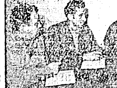
IN CLIȘEU: aspect din timpul discuției.

— Seara bună, Savoie. Da că-i fată de te-ai supărat pe noi? — D-apoi cum vorbești așa vecin, de ce să mă supăr? — Păi n-ai azi n-ai fost la învățămîntul agrozootehnic. Savoie dădu bușna în casă. Cercetă calendarul. Vectna avea dreptate. Azi făcuse cea de-a opta absență. Se întrebă nedumerită: Să fie oare vreo legătură între vis și absențele de la învățămînt. — Cîndăzi cotcidență!