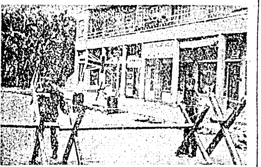
După cum se știe, la 15 ianuarie se deschide la Londra conferința în problema Ciprului. Intre timp, capitala țării, Nicosia, este controlată de trupe britanice.