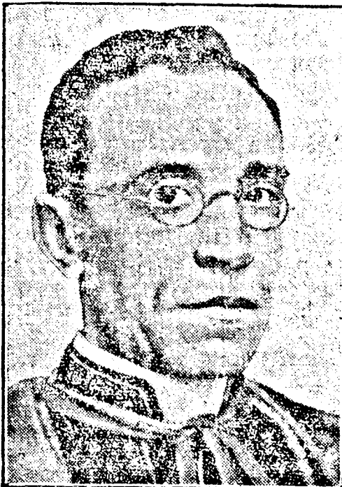
PACELLI BIBOROS-ÁLLAMTITKÁR a pápa halála óta „Camerlango biborosa.”