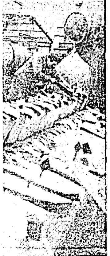
La întreprinderea mecanică pentru agricultură, un nou lot de produse sînt pregătite pentru a fi livrate beneficiarilor.

NICOLAE CEAUȘESCU președintele Republicii Socialiste România