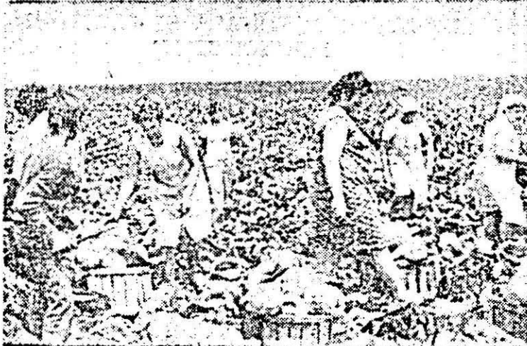
Se recoltează varză timpurie la Asociația legumicolă din Pecica.

cu opt combine și trei prese de balotat paiele, care se află deja la capătul tarlalei cu orz. De asemenea, avem asigurate șase mijloace pentru transportarea operativă a recoltei din cîmp. Producția de orz va fi bună și sîntem hotărîți cu toții, să muncim exemplar pentru ca nici un bob să nu se piardă, să adunăm întreaga recoltă la timp și s-o punem la adăpost.